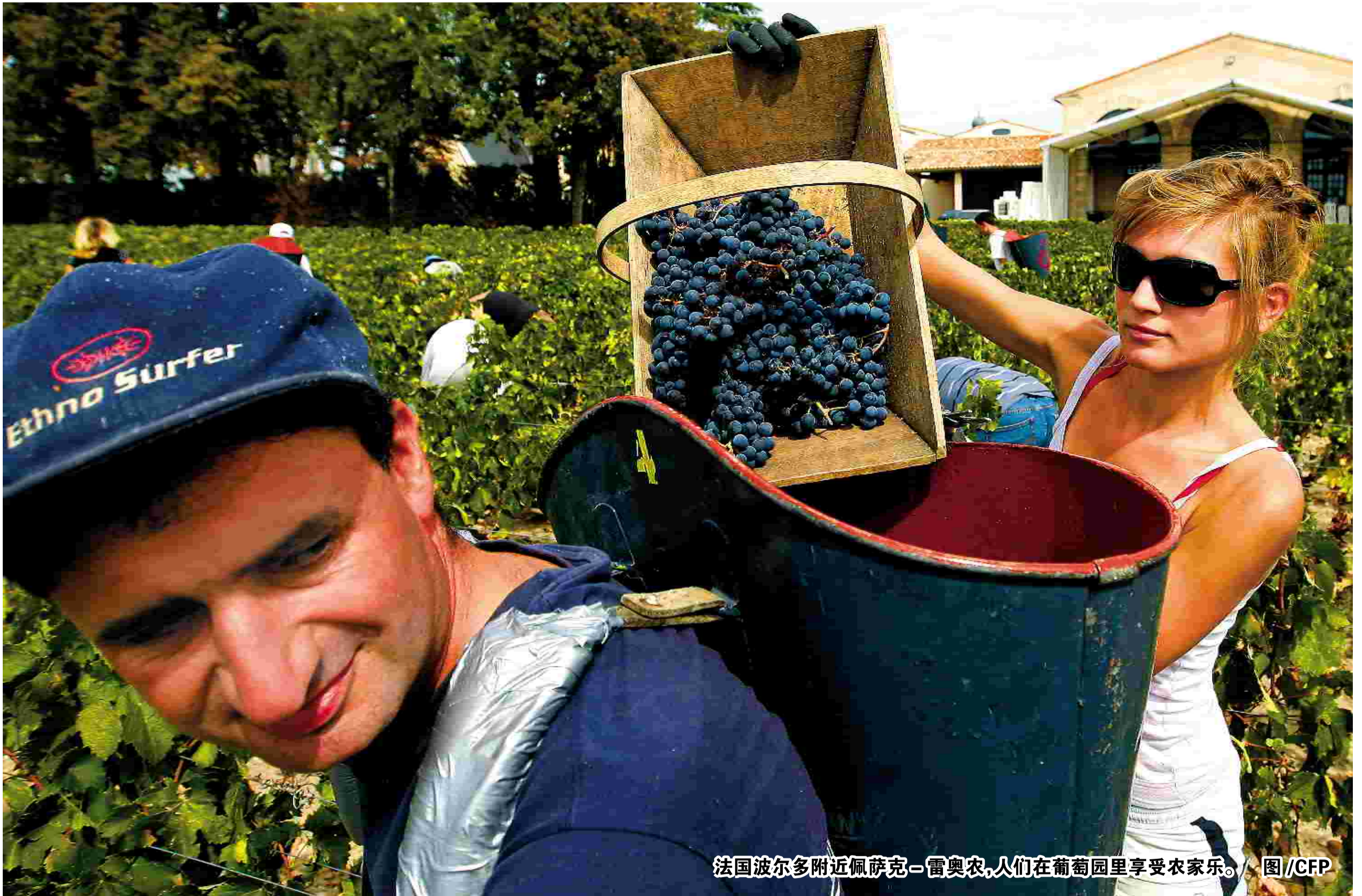
法国波尔多附近佩萨克-雷奥农,人们在葡萄园里享受农家乐。

2010年3月16日-2010年3月22日 总第1100期 本期36版 零售:2元 上海市旅游咨询服务中心主管主办 旅游时报社出版 统一刊号 CN31-0083 邮发代号 3-70 网址: www.itraveltimes.com