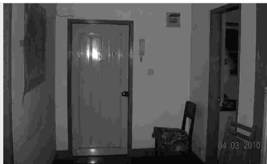
↑所谓“专门提供给外国人”的“世博人家”。