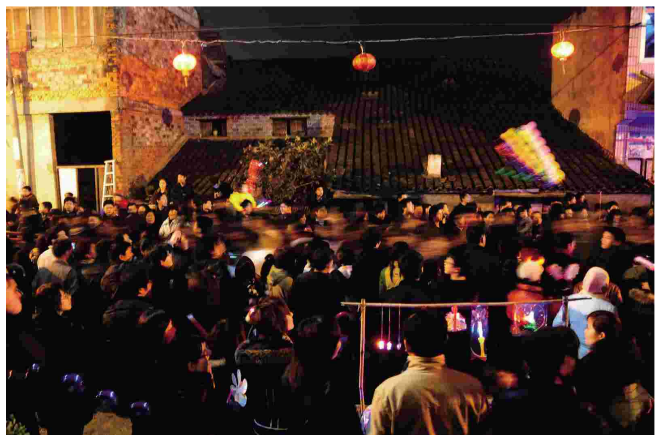
↑沸腾了的前童,如一条不停的河流。