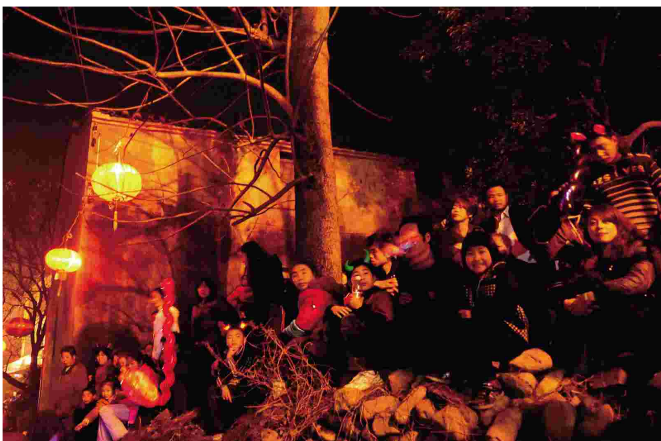
↑500年来,前童人年年如此,以感恩的心等待恩人“濠老爷”。

人民大众的节日,就是人民大众自己想办、自己办的节日。前童的500年行会,是绵绵地、持久地释放他们对先辈的崇敬,而且代代相传。