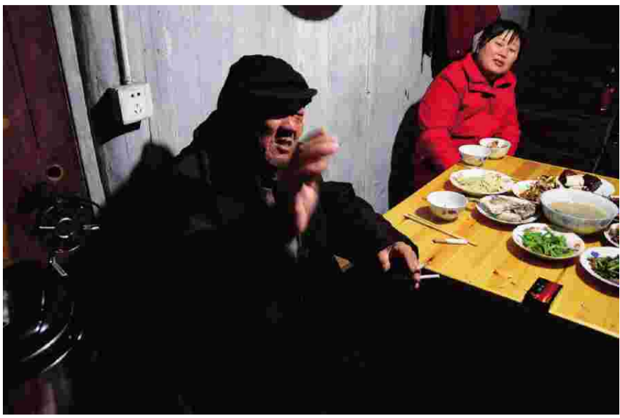
↑吃吃小菜,赶赶行会,幸福的一年就此开始了。