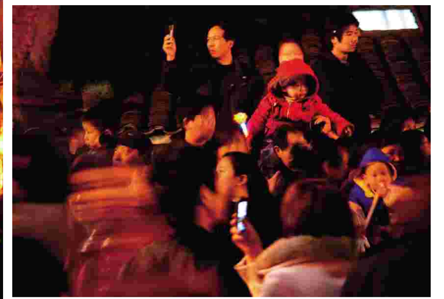
↑孩子们在庆祝的人群中被举得高高的,前童行会代代相传。