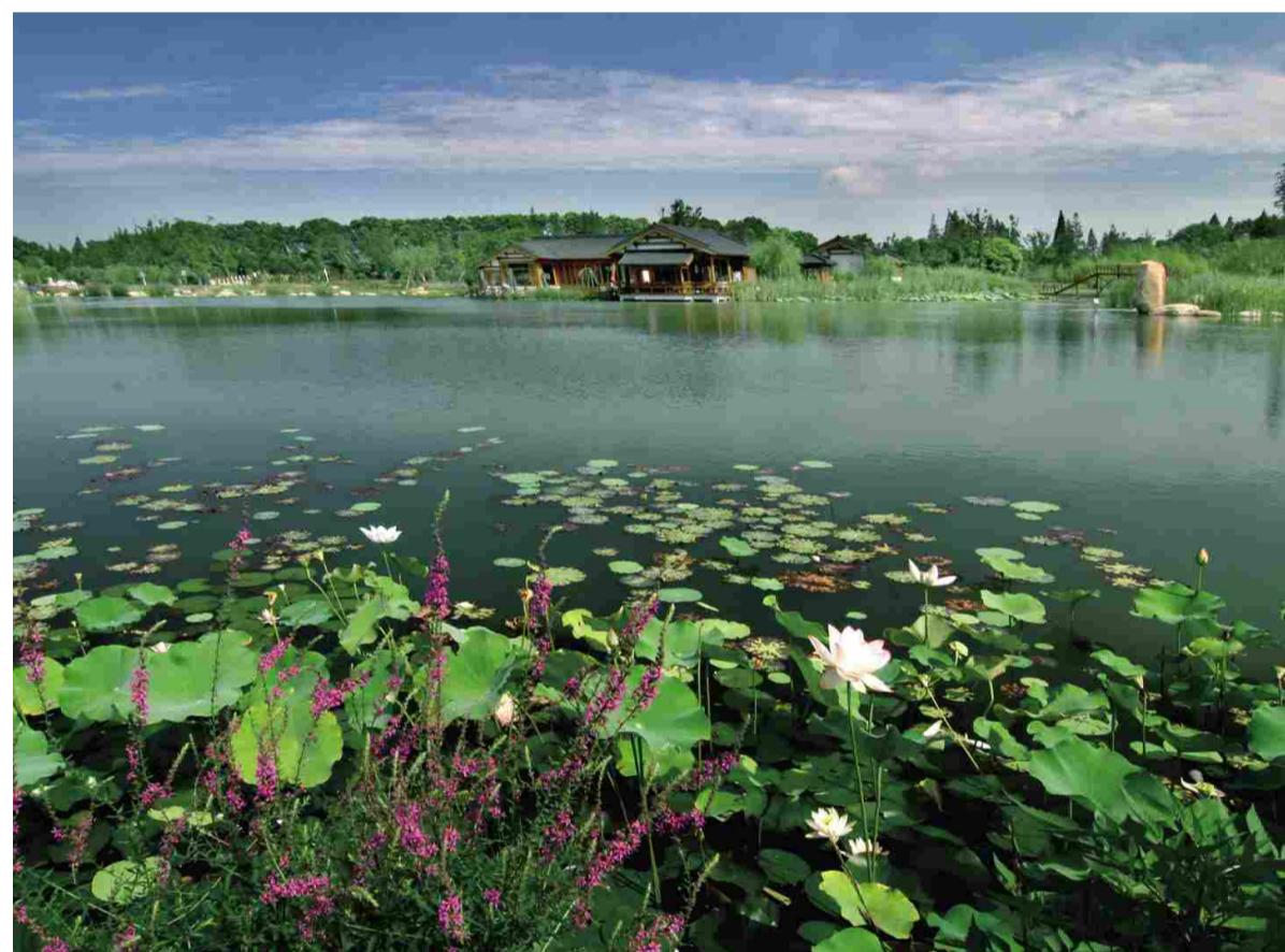
↑ 尚湖荷香洲旁边的桃花岛今年春天要加种几千棵桃树。