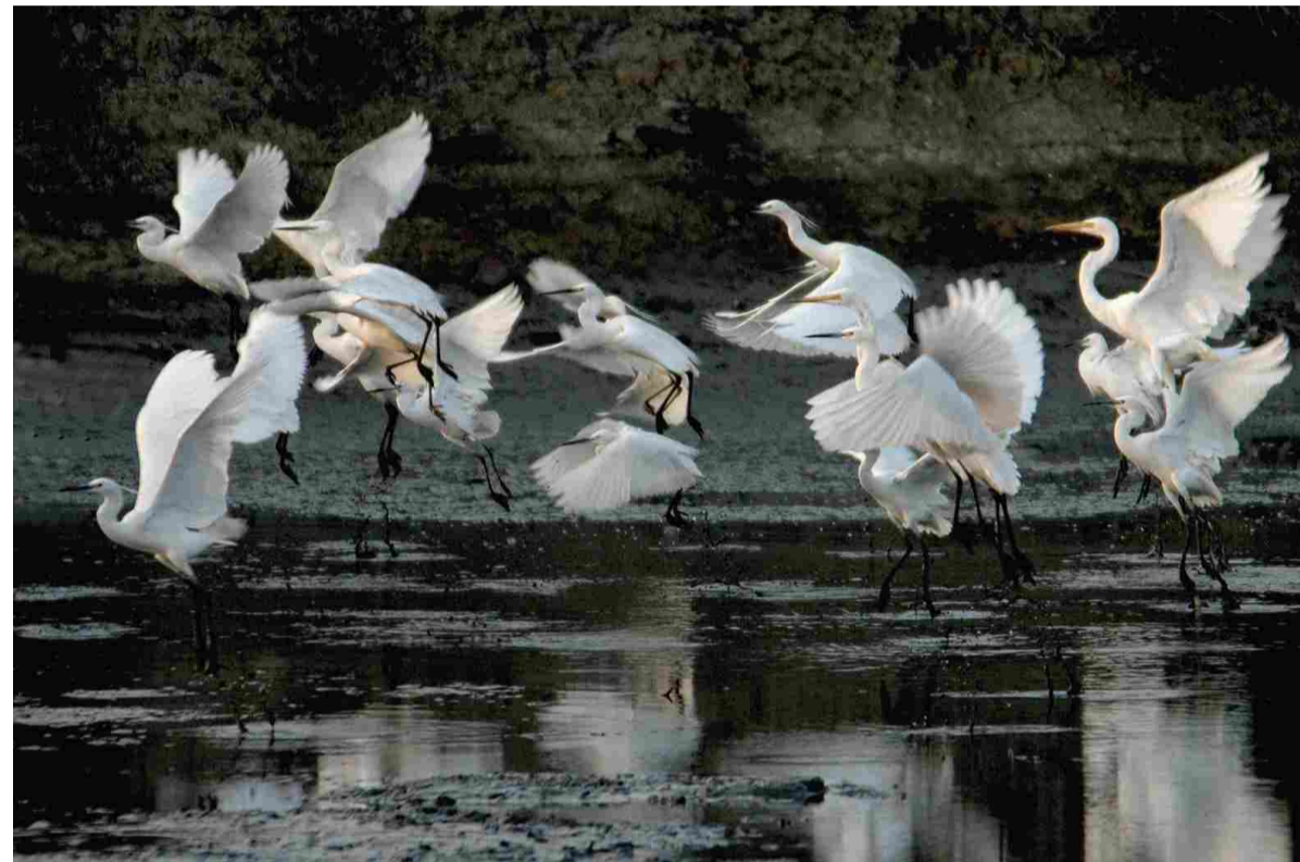
↑ 尚湖扩种了300亩池杉，就是为了留住更多的鸟，留住更多爱鸟的人。

在修复建造生态休闲景观的同时，我们今年还将大力完善基础设施。现在的兴福寺休闲广场，每天上午来此喝茶吃面已经成为常熟的休闲名片。但道路改造和停车场车位紧张是目前面临的问题，我们将在兴福寺后面新开一条路，将通路进一步打开，再完成兴福寺前面道路的改造，同时配套400辆小车的生态停车场。