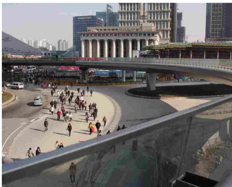
↑立体化交通将对该区域出行产生巨大变化。

跨过世纪大道抵达上海国际金融中心;世纪连廊包括陆家嘴中心绿地至地铁站和在上海国际金融中心地块内跨过银城中路进入金茂大厦地块,并进一步连接环球金融中心。将轨交站点和高楼大厦的地下层连通的地下慢行通道也已在悄然勾画。其中,东方浮庭预计将在四月底正式投入使用。