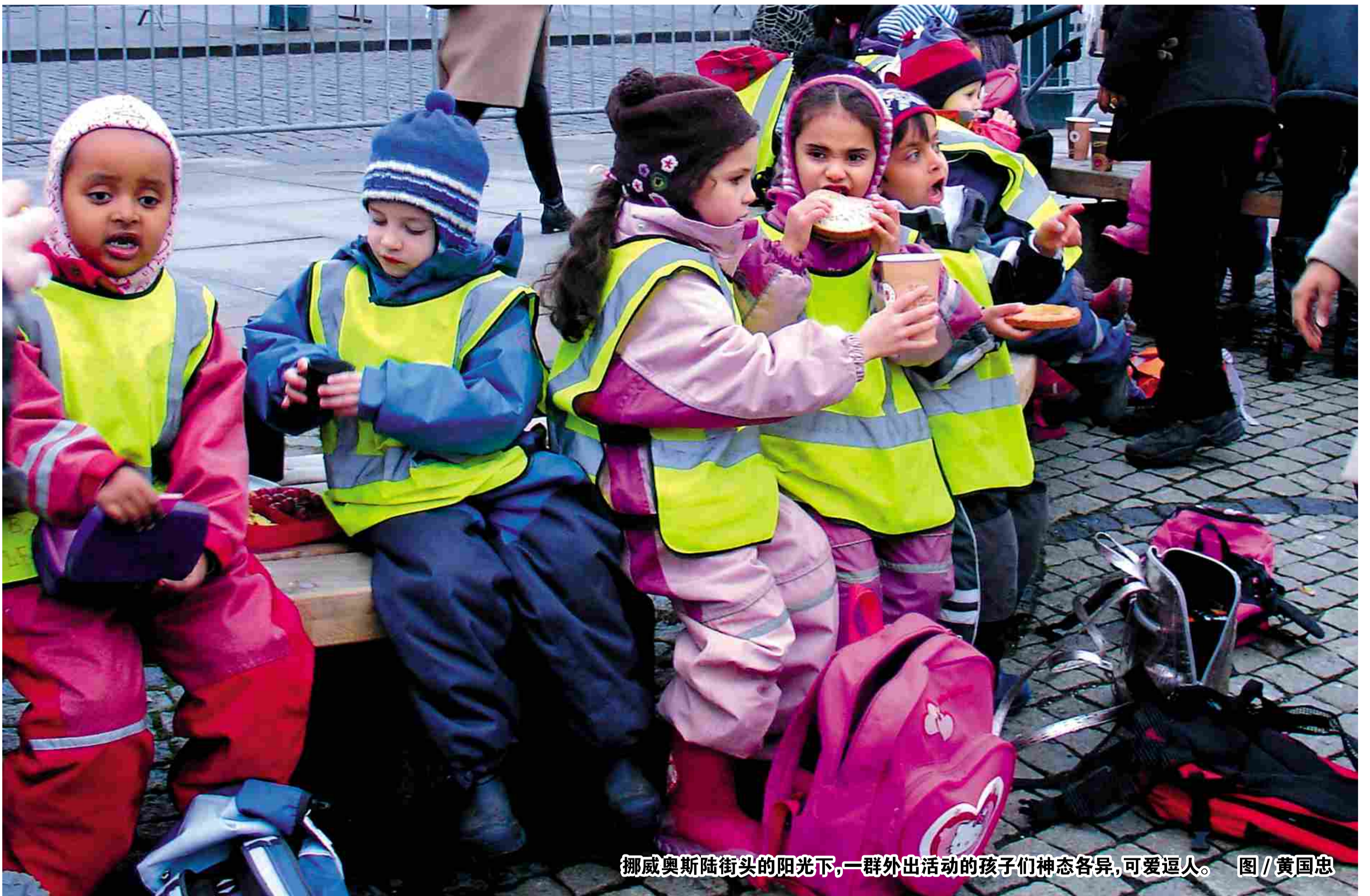
挪威奥斯陆街头的阳光下,一群外出活动的孩子们神态各异,可爱逗人。

2010年2月9日-2010年2月15日 总第1096期 本期36版 零售:2元 上海市旅游咨询服务中心主管主办 旅游时报社出版 统一刊号 CN31-0083 邮发代号 3-70 网址: www.itraveltimes.com